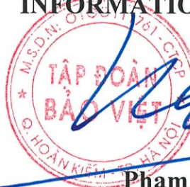
Pham Ngoc Tu